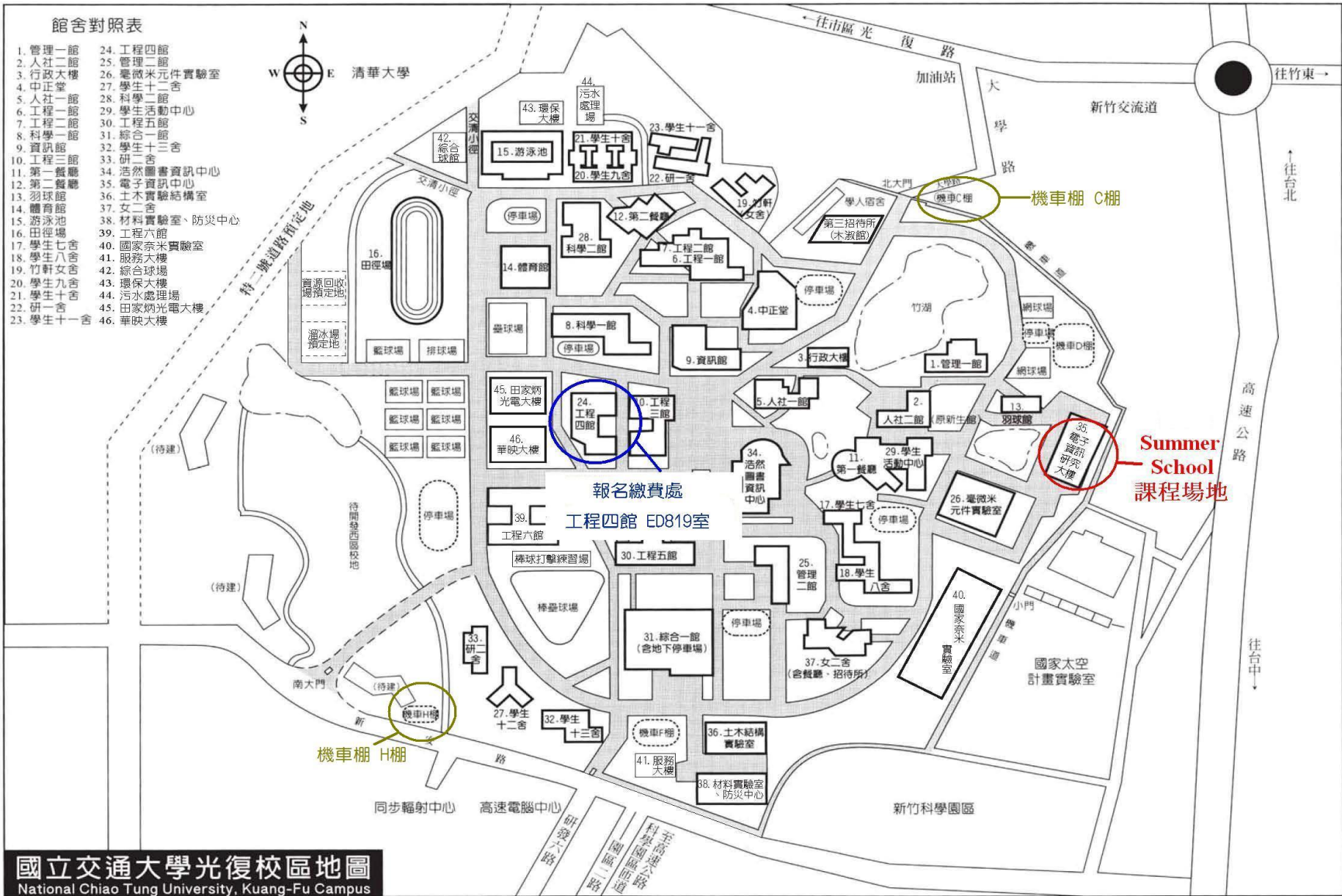
國立交通大學光復校區地圖 National Chiao Tung University, Kuang-Fu Campus